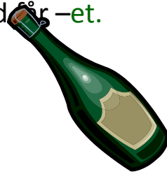
en/ei flaske – flasken (-a)