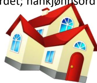
et hus - huset