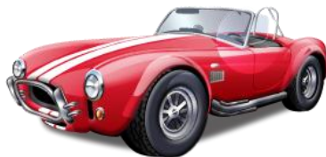
en bil – bilen

Dersom substantiv står i bestemt form kan vi se kjønn ut ifra endelsen på ordet; hankjønnord får -en , hunkjønnord får -en eller -a og intetkjønnord får -et .